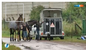
Achtjähriger stirbt auf Reiterhof nach Pferdetritt