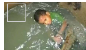
Dreijähriger aus Abwasserkanal gerettet